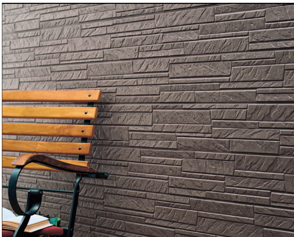
デザインシリーズ16 「雅石柄Ⅱ」 色: 雅石ビターブラウン

住まいの外まわりを提供する、外装建材メーカーのケイミュ株式会社(本社:大阪市中央区、社長:小森隆)は、全社のスローガンである“暮らしをまもる、住まいを魅せる”の実現に向けて、このたび金属サイディング はる・一番 デザインシリーズ16に、新商品「細石柄Ⅱ」「雅石柄Ⅱ」「斜石柄Ⅱ」を発売することとなりました。